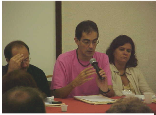
Figura 21: Discussão do Como andam as matrónoles .