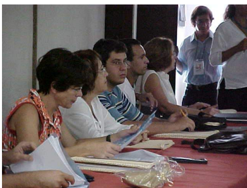
Figura 27: Membros da Rede Metrôpoles durante fechamento da proposta Instituto do Milênio .