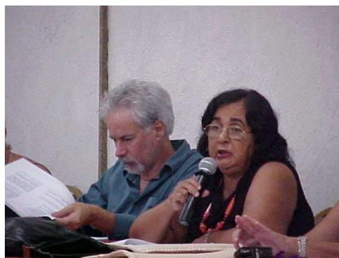
Figura 17: Equipe do Pará durante apresentação e discussão da proposta Instituto do Milênio.