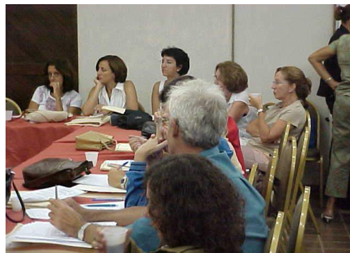
Figura 30: Fechamento da proposta Instituto do Milênio .