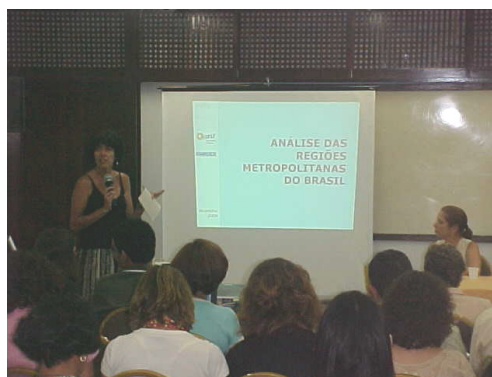
Figura 07: Exposição “Análise das Regiões Metropolitanas do Brasil”.