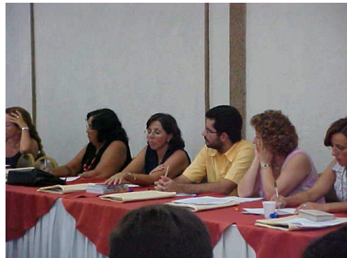
Figura 22: Membros da Rede Metrôpoles na discussão do Como Andam .