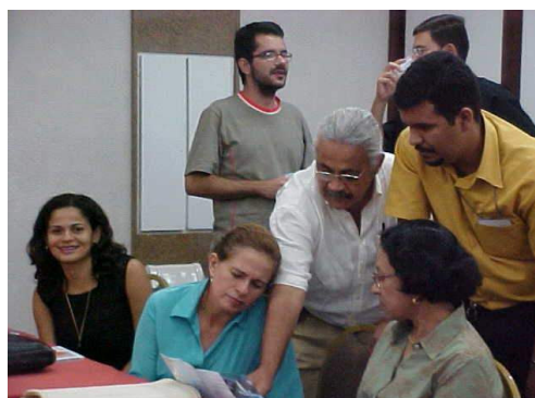
Figura 26: Equipe RMNatal durante discussão da proposta Instituto do Milênio .

➤ A inserção de cada equipe da Rede no projeto será efetuada de acordo com o nível de inserção na Rede e avanço na pesquisa.