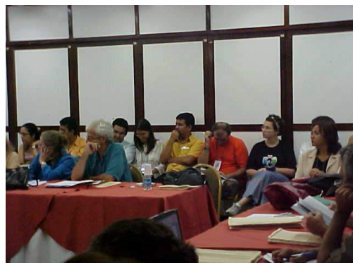
Figura 29: Fechamento da proposta Instituto do Milênio.