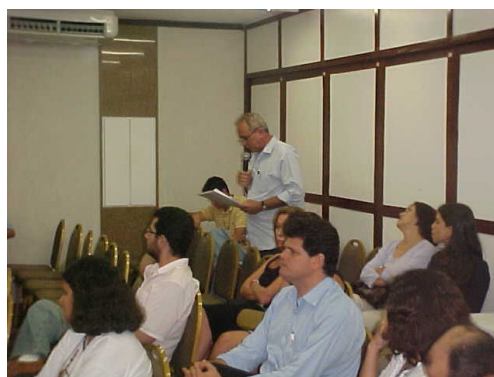
Figuras 13 e 14: Intervenções feitas durante o debate.