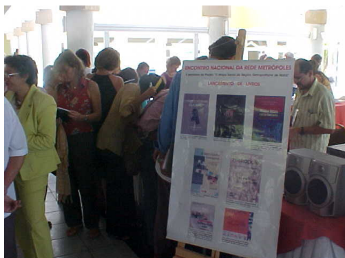
Figura 06: Lançamento de livros.