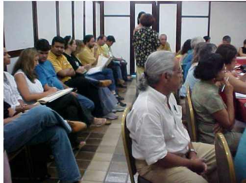
Figura 28: Fechamento da proposta Instituto do Milênio .