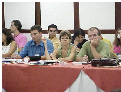
Figura 16: Componentes da Mesa de debates durante apresentação e discussão.