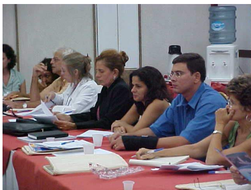
Figura 18: Equipe RMNatal durante discussão e fechamento do projeto Como Andam as Metrôpoles .

A discussão Como Andam as Metrôpoles teve a coordenação da Professora Luciana Andrade (PUC-Minas) e, segundo relato feito in loco , abordou os seguintes assuntos: