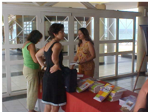
Figura 05: Lançamento de Livros.