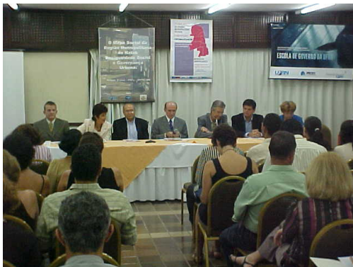
Figura 01: Componentes da Mesa de Abertura do Encontro Nacional.

Conforme acordado entre as equipes componentes da Rede Metr p les, o evento teve as atividades desenvolvidas em seu primeiro dia (30 de mar o) abertas   comunidade em geral, tendo sido iniciado com abertura solene.