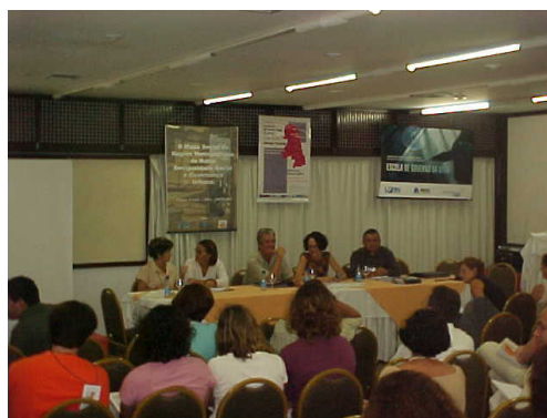
Figura 12: Mesa de debatedores.