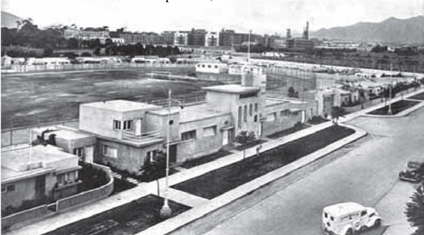
Bairro de Operários, em Lima-1936