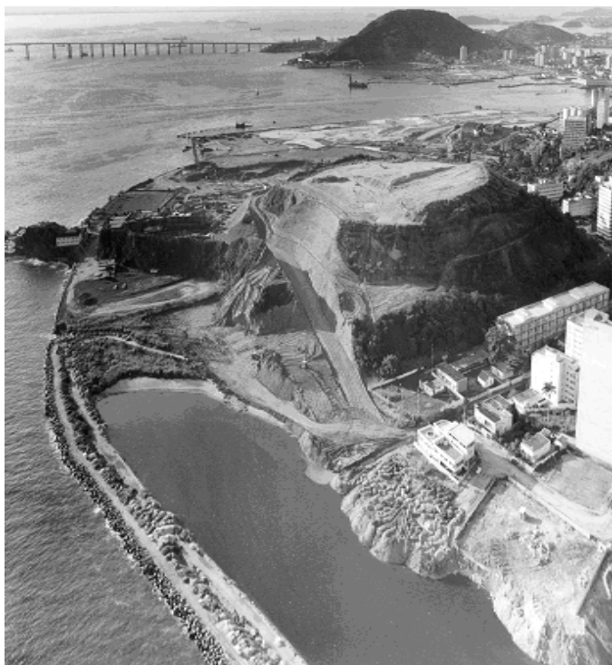
Figura 5: Desmorte do Morro do Gragoatá, e aterro da Orla de Niterói sobre a Baía de Guanabara, em 1974.

terrenos que somente agora, mais de 50 anos depois de sua instituição, têm através do Caminho Niemeyer, a consolidação definitiva de seu uso e apropriação 8 (Figura 5).