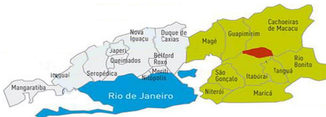
Figura 1: Mapa da Região Metropolitana do Rio de Janeiro.

O município de Niterói localiza-se no sudeste brasileiro, no estado do Rio de Janeiro e integra a Região Metropolitana do Rio de Janeiro (Figura 1).