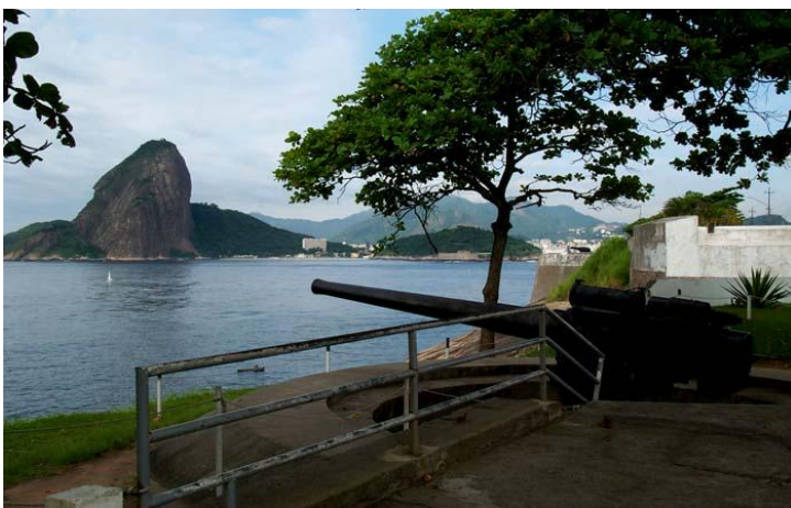
Figura 2: Instalações do Forte Santa Cruz na entrada da Baía de Guanabara. Ao fundo podemos observar, do outro lado da baía, o Pão de Açúcar e a cidade do Rio de Janeiro.

A cidade construiu a sua vida econômica, social e política vinculada a elementos do passado que irão influenciar durante longo tempo a constituição de sua identidade e da simbologia que a significou, como uma cidade complementar ao Rio de Janeiro e suas funções, quer, no passado, em sua defesa, com um sistema de fortes, ainda presentes na sua paisagem (Figura 2), quer como importante área de influência econômica e política, como capital do Estado do Rio de Janeiro, ao lado do Rio de Janeiro como capital do Brasil, ao longo de boa parte de sua existência.