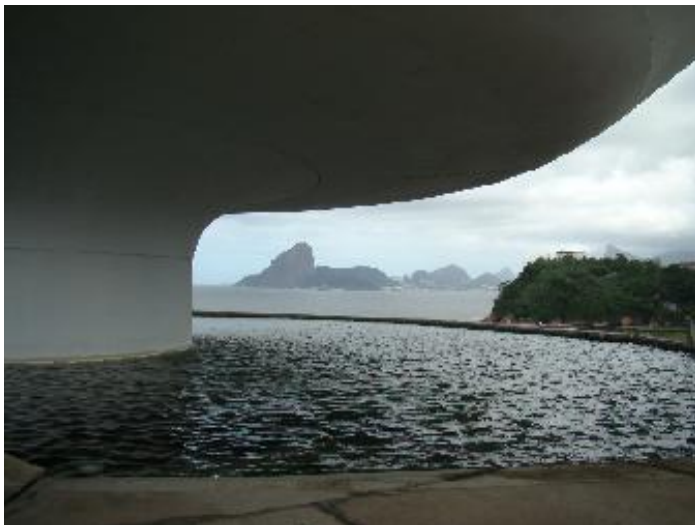
Figura 3: Vista do MAC para a cidade do Rio de Janeiro, do museu é possível observar o Pão de açúcar, o Corcovado e a Baía de Guanabara.

Após a conclusão da construção do Museu de Arte Contemporânea em 1996, a prefeitura da cidade começou uma campanha para tornar o museu o principal elemento de propaganda da cidade, onde o MAC deveria passar a imagem de cidade moderna, globalizada e de futuro. A imagem do museu se transforma em símbolo da cidade. Essa imagem é utilizada/instrumentalizada para projetar a cidade no Brasil e no mundo. Antes da construção do MAC, era utilizado nos documentos oficiais da cidade o brasão do município e após a conclusão da obra, o desenho do museu passou a ser utilizado pelos órgãos públicos do município.